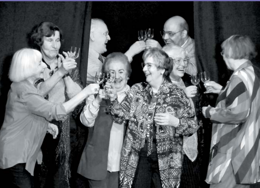
Zusammen eine Situation gestalten